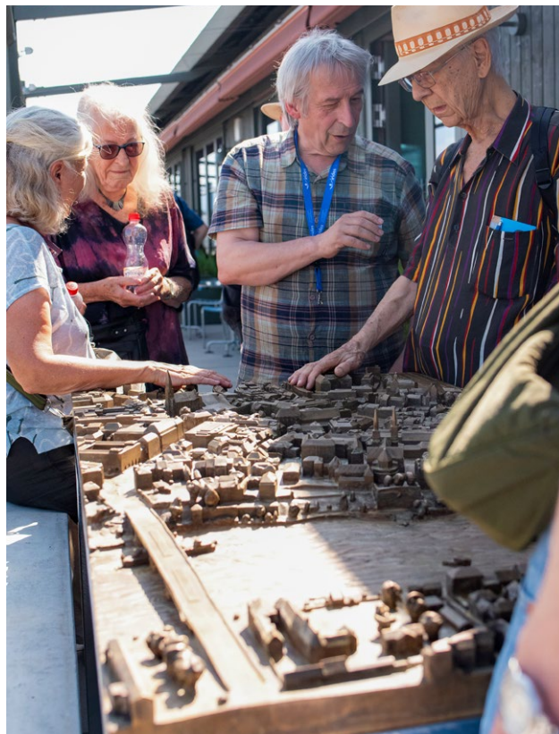
Vernissage «Kunst am Bau»