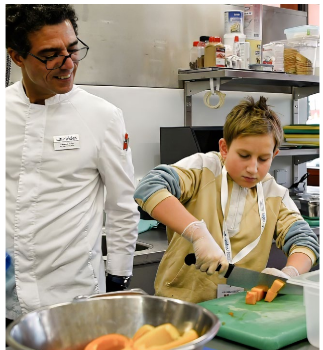
«Zukunftstag» – Berufswelt Küche erleben