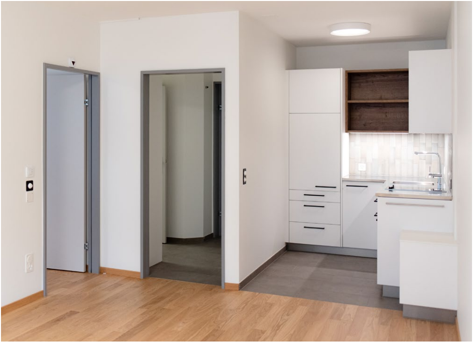
Sanierte Wohnung, Steingraben 75