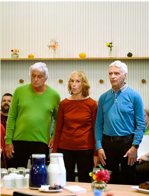
Hauptprobe der «Blindsingers»