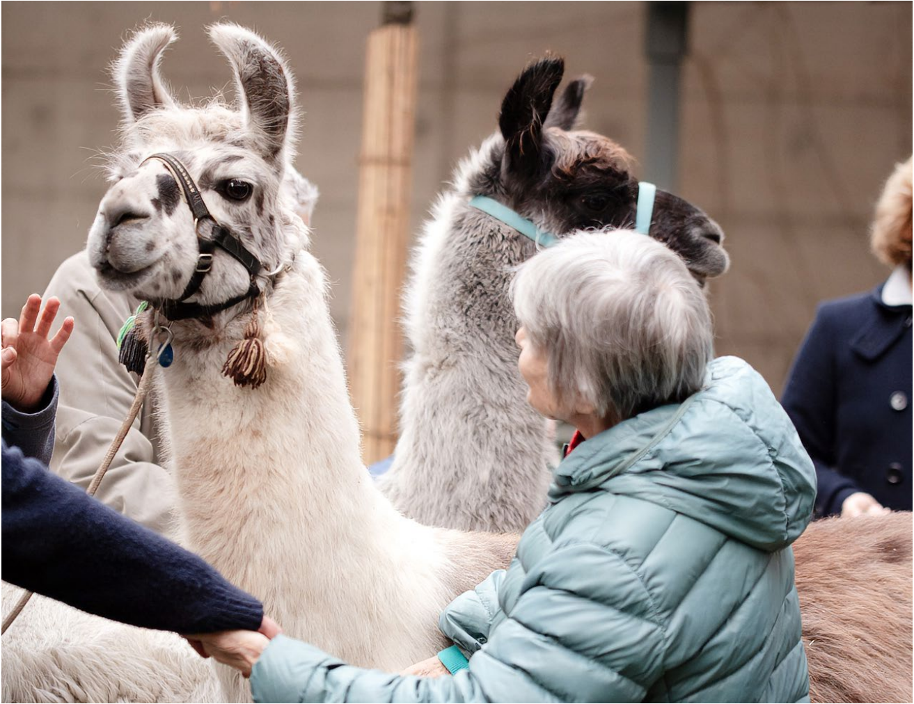
Besondere Begegnung – Lamas und Bewohnende