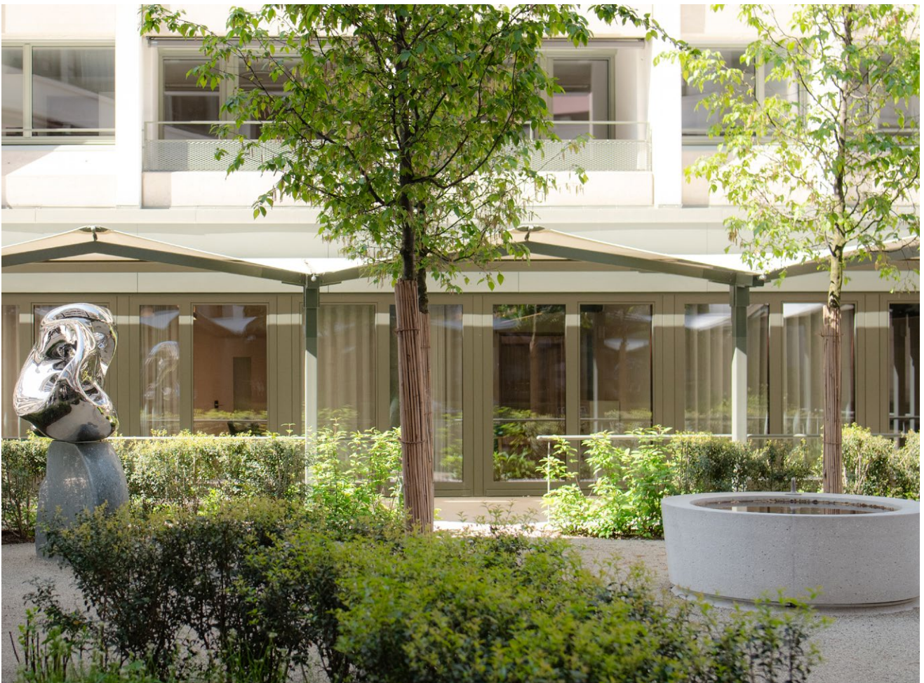
Innengarten mit Blick auf die Liegenschaft am Steinengraben 75

Das Berichtsjahr 2025 der irides AG war geprägt vom Abschluss zentraler Bau- und Sanierungsprojekte sowie von betrieblichen und personellen Herausforderungen. Neben der Weiterentwicklung der Organisation standen die Sicherung wirtschaftlicher Abläufe sowie der Ausbau inklusiver Arbeitsplätze im Fokus. Gleichzeitig wurden wichtige Grundlagen für die Konsolidierung des Betriebs gelegt.