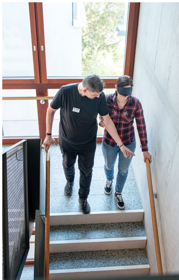
«Willkommenstag» – Sensibilisierung neuer Mitarbeitenden

Aufbau und das professionelle Management inklusiver Teams, zu dem auch das mobile Betreuungsteam gehört: Mitarbeitende mit IV-Rente erbringen Betreuungsleistungen für Menschen mit Unterstützungsbedarf und übernehmen dabei eine sinnstiftende Tätigkeit. Gleichzeitig erfordert dieses Modell eine hohe fachliche und organisatorische Sorgfalt, da Mitarbeitende, die selbst Unterstützung benötigen, andere Personen beispielsweise beim Einkaufen begleiten, Personen im Rollstuhl unterstützen oder gemeinsame Freizeitaktivitäten wie Spaziergehen oder gemeinsame Spiele durchführen. Über 20 Prozent der Mitarbeitenden von irides beziehen eine IV-Rente – ein sichtbarer und nachhaltiger Beitrag zur Teamarbeit und Inklusion.