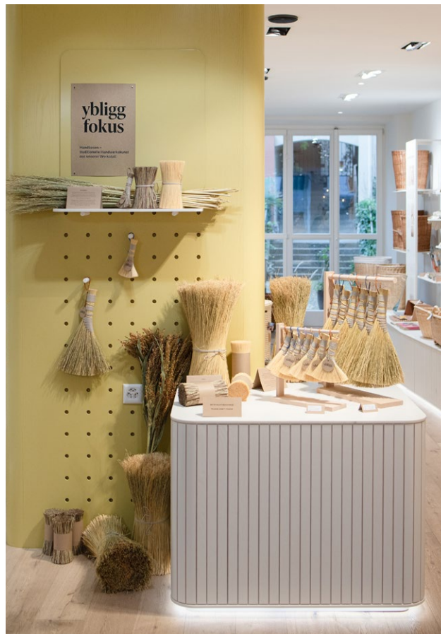
Neues Format – «yblig fokus»

Nach dem Abschluss der Bau- und Sanierungsphase wird sich der Fokus im kommenden Jahr auf die Konsolidierung des Betriebs richten. Im Mittelpunkt stehen dabei die fortlaufende Optimierung der bereichsübergreifenden Prozesse, klar definierte Zuständigkeiten sowie eine effiziente Nutzung der personellen Ressourcen. Die erfolgreiche Integration inklusiver Arbeitsplätze und die gelungene Einbettung von irides ins Quartier sollen gezielt weiterentwickelt und langfristig gesichert werden. Vor dem Hintergrund des anhaltenden Fachkräftemangels bleibt der Aufbau stabiler Teams sowie die Attraktivität von irides als Arbeitgeberin ein zentrales betriebliches Anliegen.